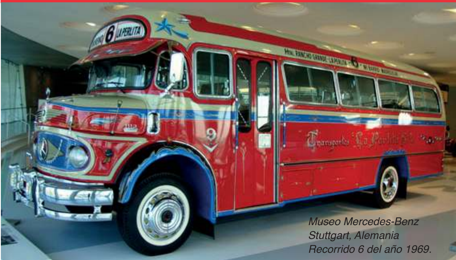
Museo Mercedes-Benz Stuttgart, Alemania Recorrido 6 del año 1969.

El modelo que se encuentra en la fotografía se fabricó en la planta de Mercedes-Benz en Virrey del Pino, utilizando un chasis de camión de origen alemán y una carrocería típica de colectivo argentino.