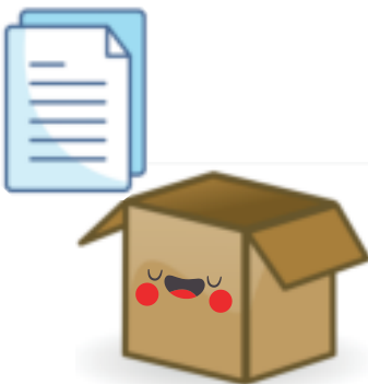
PAPEL Y CARTÓN