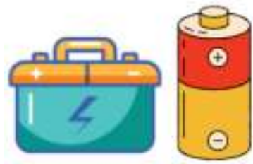
PILAS Y BATERÍAS